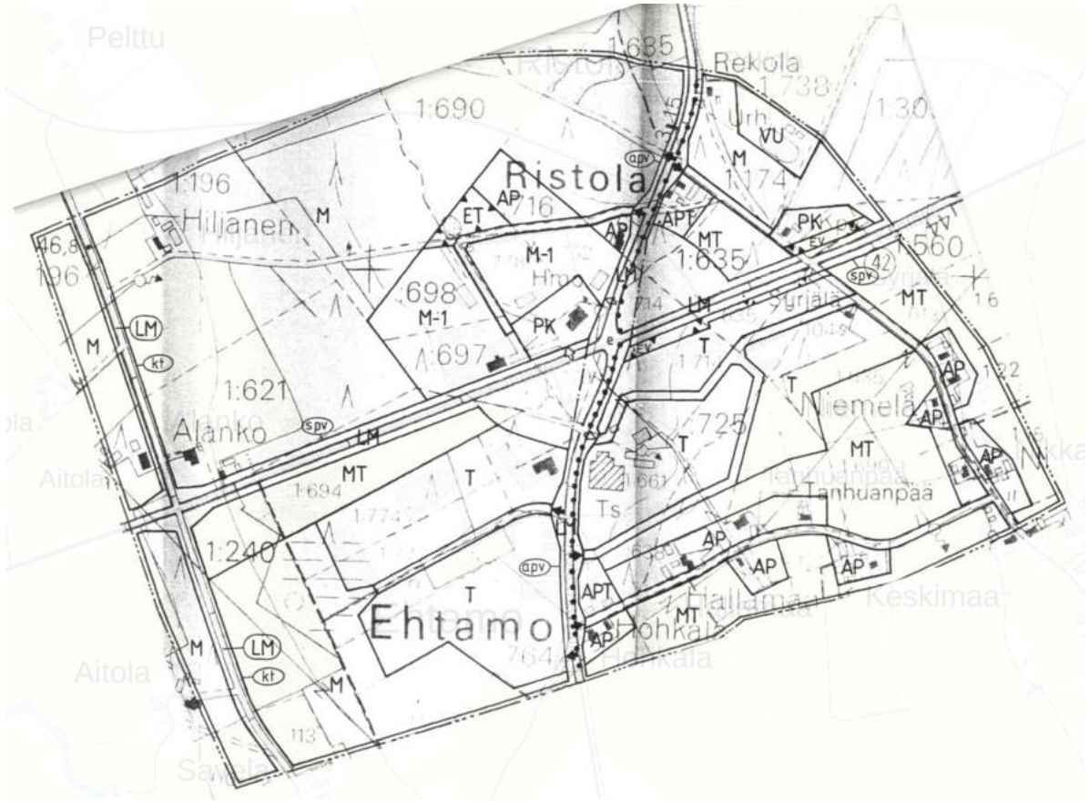
Kuva 5-3. Oikeusvaikutukseton Ristolan yleiskaava vuodelta 1994.