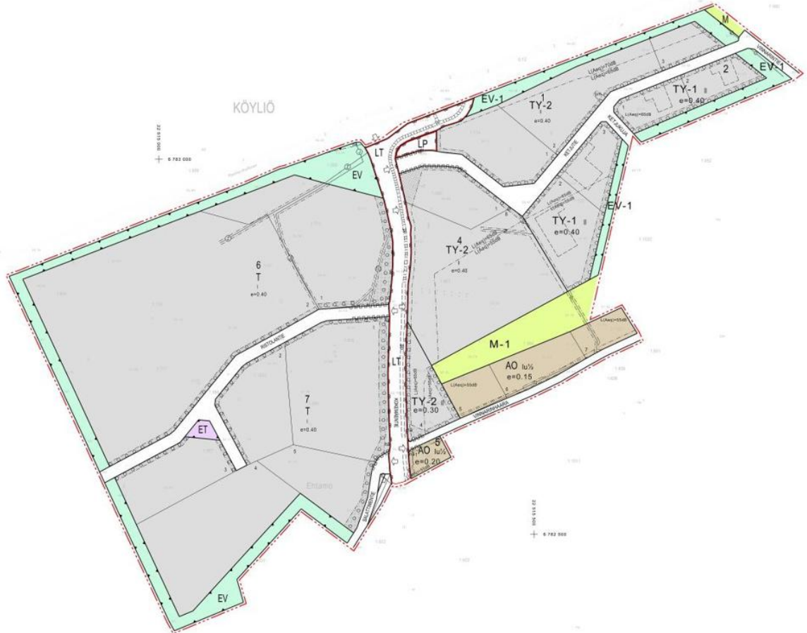
Kuva 5-4. Ote ajantasa-asemakaavasta valtatie eteläpuolella.

(MT) sekä yleisen tien alue (LT) ja yleinen pysäköintialue (LP). Kaava-alueen reunoille on osoitettu suojaviheralue (EV-1).