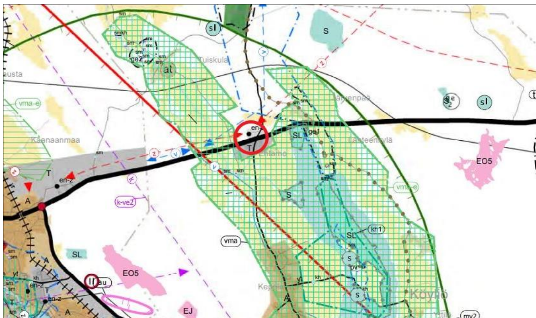
Kuva 5-1. Ote Satakunnan maakuntakaavojen yhdistelmästä ja asemakaava-alueen likimääräinen sijainti punaisella soikiolla.

Alueella ovat voimassa Satakunnan maakuntakaava, 1. sekä 2. vaihemaakuntakaava.